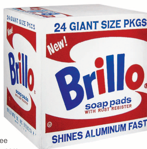
Brillo box , de Andy Warhol (1964).

Es una revelación cotejar el Don Quijote de Menard con el de Cervantes. Éste, por ejemplo, escribió (Don Quijote, primera parte, noveno capítulo):