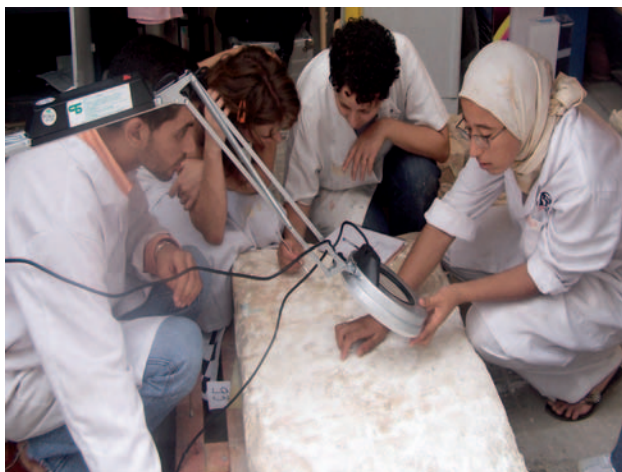
Izquierda. Clase práctica en el taller de materiales pétreos.

Derecha. Clase práctica en el taller de pintura.