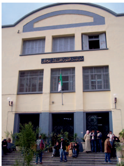
Entrada principal de la Escuela Regional de BB.AA. de Orán.

El curso se divide en 3 trimestres, comenzando en octubre y finalizando en junio, además de tener las prácticas del mes de agosto obligatorias para todos los alumnos. A continuación se muestra un cuadro con las horas totales de teoría y práctica que se imparten durante un año lectivo de 9 meses.