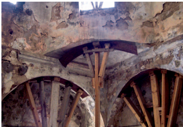
Intervenciones en la estructura de los baños turcos (1708).