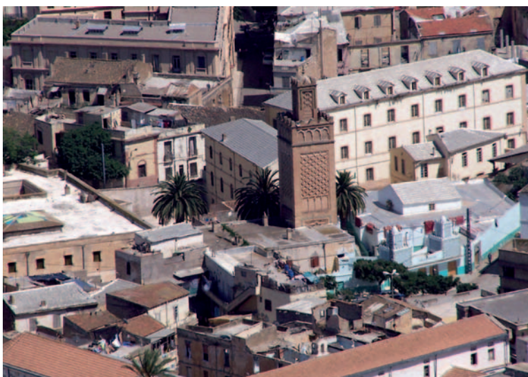
Vista de la Mezquita de la Perla, Orán.