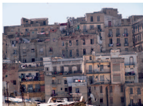
Vista del Barrio de Sidi El Houari (Orán).

Con ello, buscamos involucrar de lleno a los organismos públicos en la necesidad de una buena Gestión del Patrimonio para obtener este fin.