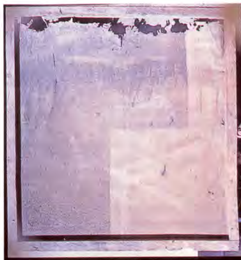
4. Único documento fotográfico existente del bastidor original de La Resurrección de Cristo del Panteón Real del Monasterio de San Salvador de Oña. Burgos.