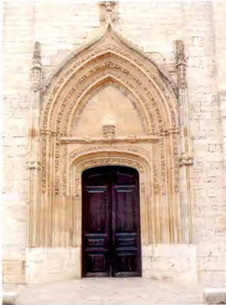
1. Lugar de emplazamiento.