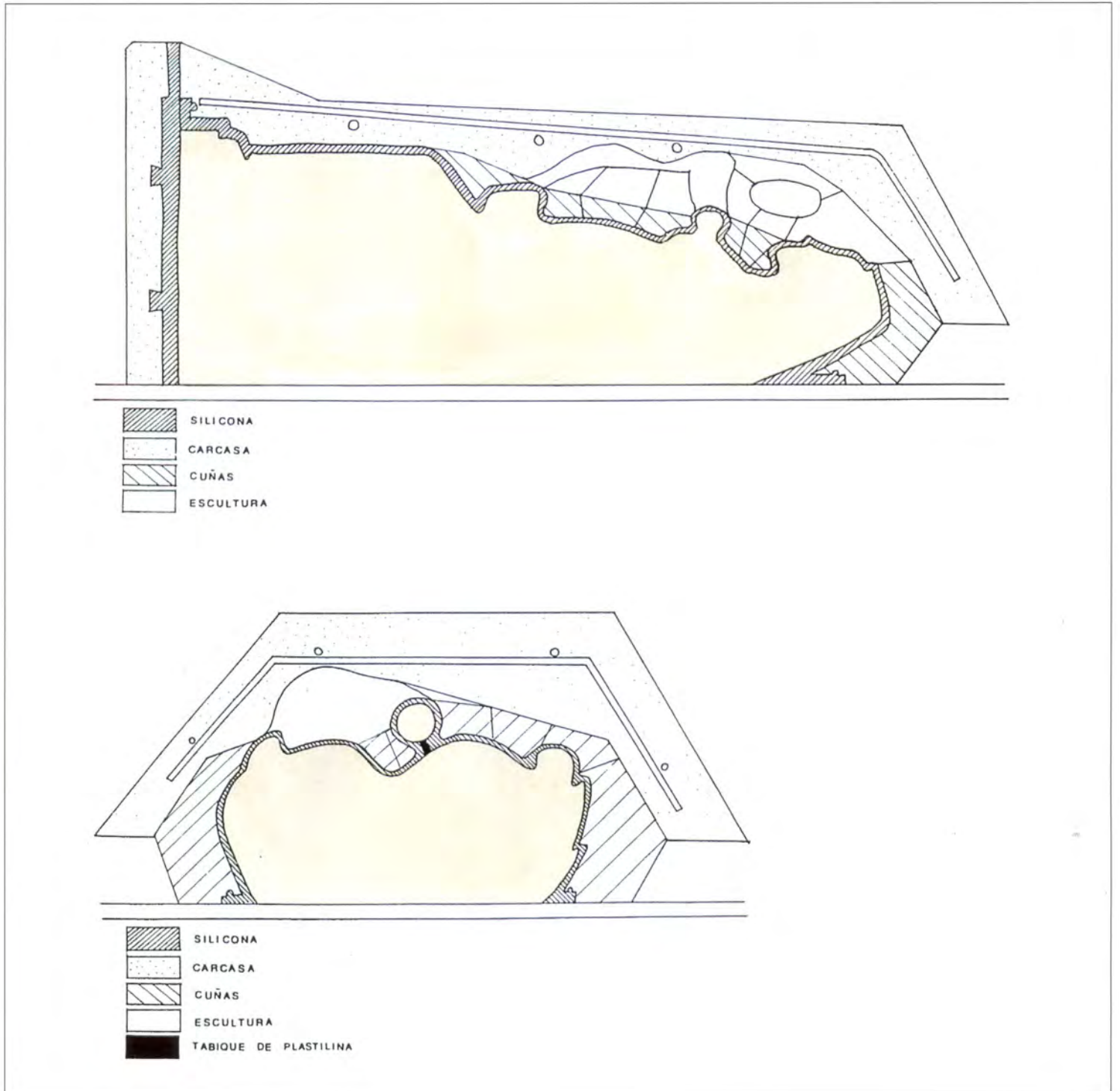
Secciones longitudinal y trasversal del molde.