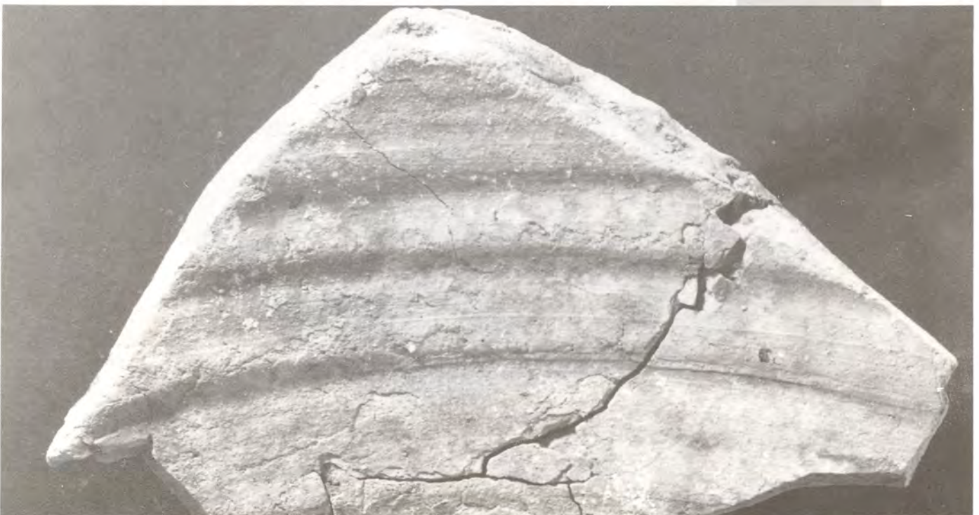
Fisuras producidas por el secado incontrolado.

Conductividad en el momento de la extracción: 49,4 \mu\text{S} (Escala = 200) (después de 3 días sin cambiar el agua). Test de cloruros: negativo.