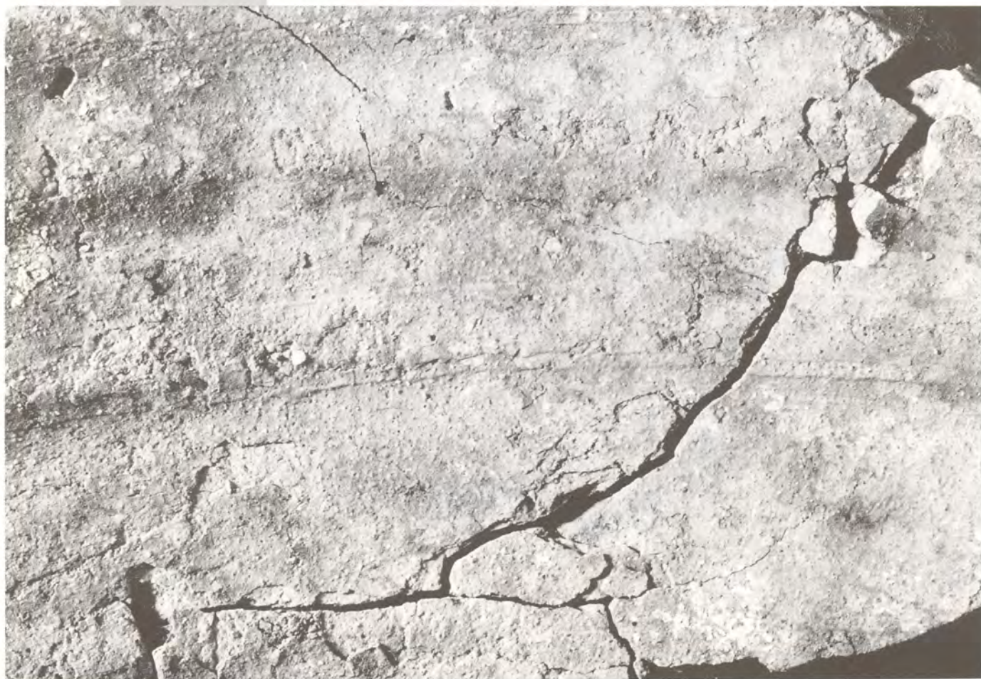
Fisuras producidas por el secado incontrolado.

No obstante, se dejan en el agua los fragmentos que primero se introdujeron con la única finalidad de obtener en la gráfica realizada, una curva lo más larga posible. El interés de esta gráfica consiste en obtener una aproximación al comportamiento que muestra la desalación de un objeto que se supone afectado al máximo, por su procedencia de medio marino. El perfil obtenido revela un proceso muy largo e incluso “desalentador”. A la gran alza y descenso iniciales, seguramente motivados por una saturación superficial que se elimina los dos primeros días (saturación ocasionada por la migración de sales propia del secado) sigue una curva monótona, en la que no se aprecia un verdadero descenso a partir de cierto momento. Los picos indican aquellos días (fin de semana, períodos vacacionales, etc.) en que el agua no se ha cambiado y se produce en ella acumulación de sales. En realidad lo que controlamos es las sales que un determinado volumen de agua capta en un espacio de tiempo (un día por ejemplo, ya que si se acumulan, al cambiar, el agua, se recupera el nivel “antiguo”) aunque intervienen otros parámetros como temperatura o evidentemente grado de pureza del agua. Pero cuántas sales tiene todavía la pieza, en relación con las que cada día medimos, traducido a tiempo que puede durar el proceso son cuestiones todavía por ver, más bien imprevisibles.