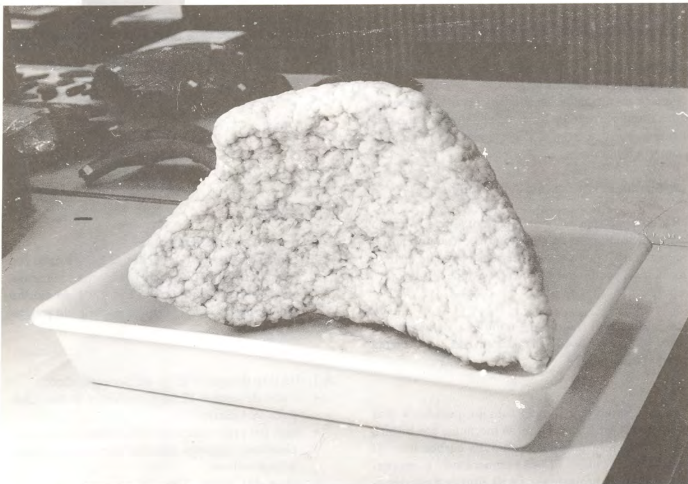
3. Prueba de desalación mediante el método de la pulpa de papel.

Para acelerar la humidificación se rocían de vez en cuando con agua desionizada, por aspersión. Se man-