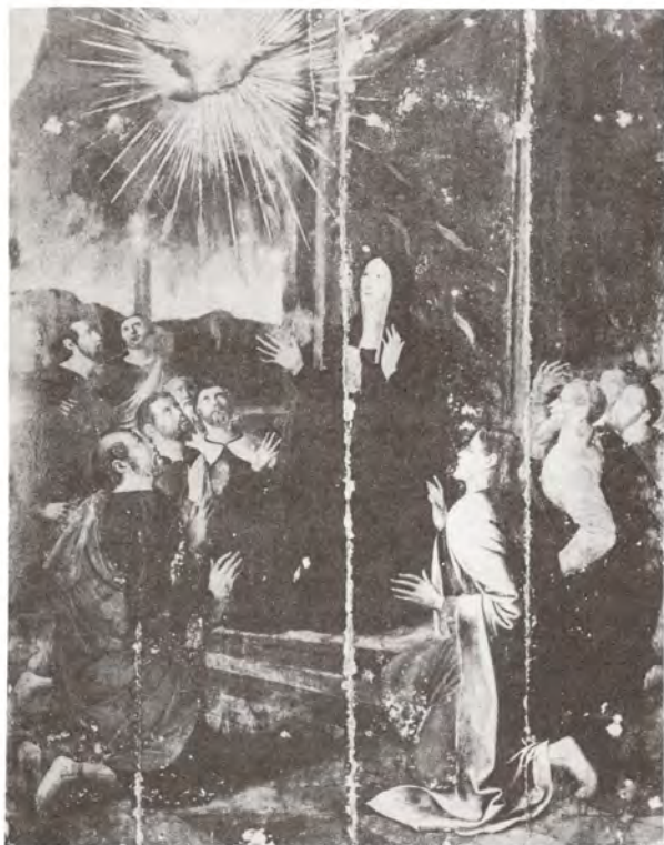
Anverso de la Tabla, una vez iniciada la limpieza.

1) En primer lugar se realizó una limpieza del estrato superficial, que presentaba polvo y gotas de cera, para