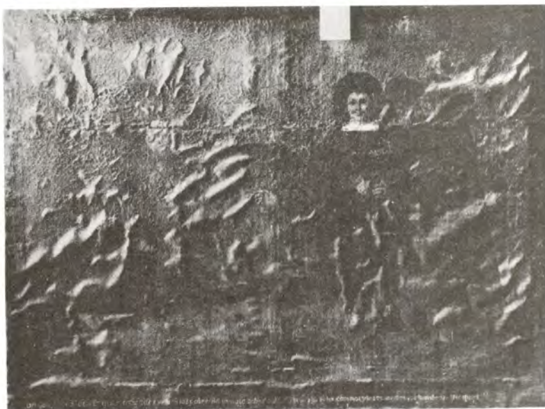
San Amaro y los pobres del camino. Aspecto antes de la restauración. Fotografía con luz rasante.

Hubo un cuadro que reaccionó negativamente al tratamiento dado: en plena forración se formaron bolsas de aire entre la preparación y la capa de pintura y tuvimos que inyectar cola de conejo haciendo una perforación de entrada con la aguja de una jeringuilla y otra de salida en los extremos de las bolsas, las rellenamos de cola y esperamos un tiempo prudencial antes de plancharlas.