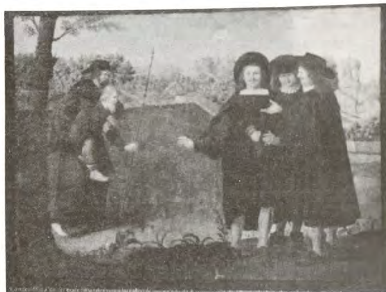
El mismo cuadro anterior, finalizado el proceso de restauración.

Al final logramos solucionar el problema. Creemos que esto fue debido a la excesiva humedad a que fue sometido el cuadro, al día lluvioso en que efectuamos su forración, y a que estas salas sin calefacción alguna, permite mayor acumulación de humedad en el ambiente.