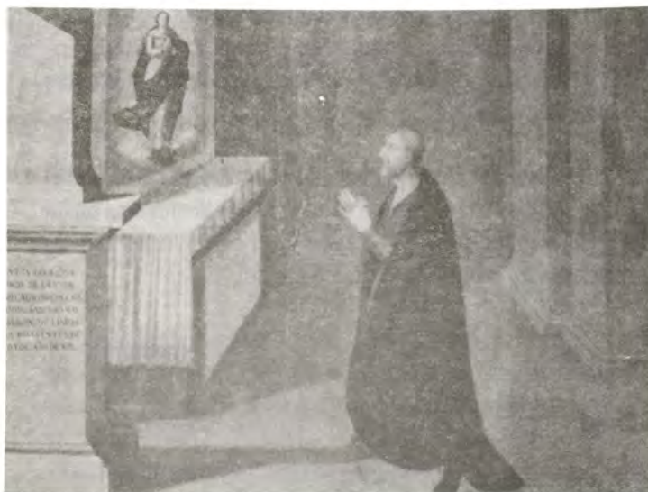
La misma pintura, luego de su restauración.

Queremos agradecer a la Dirección de la Escuela las gestiones y la oportunidad que nos ha brindado para trabajar para el Patrimonio Nacional y, también dar gracias a los restauradores del Palacio, Paco Torrón, Manuel Calderón e Isabel Pernas, que siempre estuvieron dispuestos a ayudarnos cuando lo necesitamos.