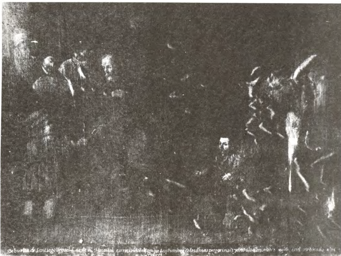
San Amaro llegando al hospital. Estado del cuadro antes de la restauración. Se observan abombamientos en la pintura y un ennegrecimiento general.